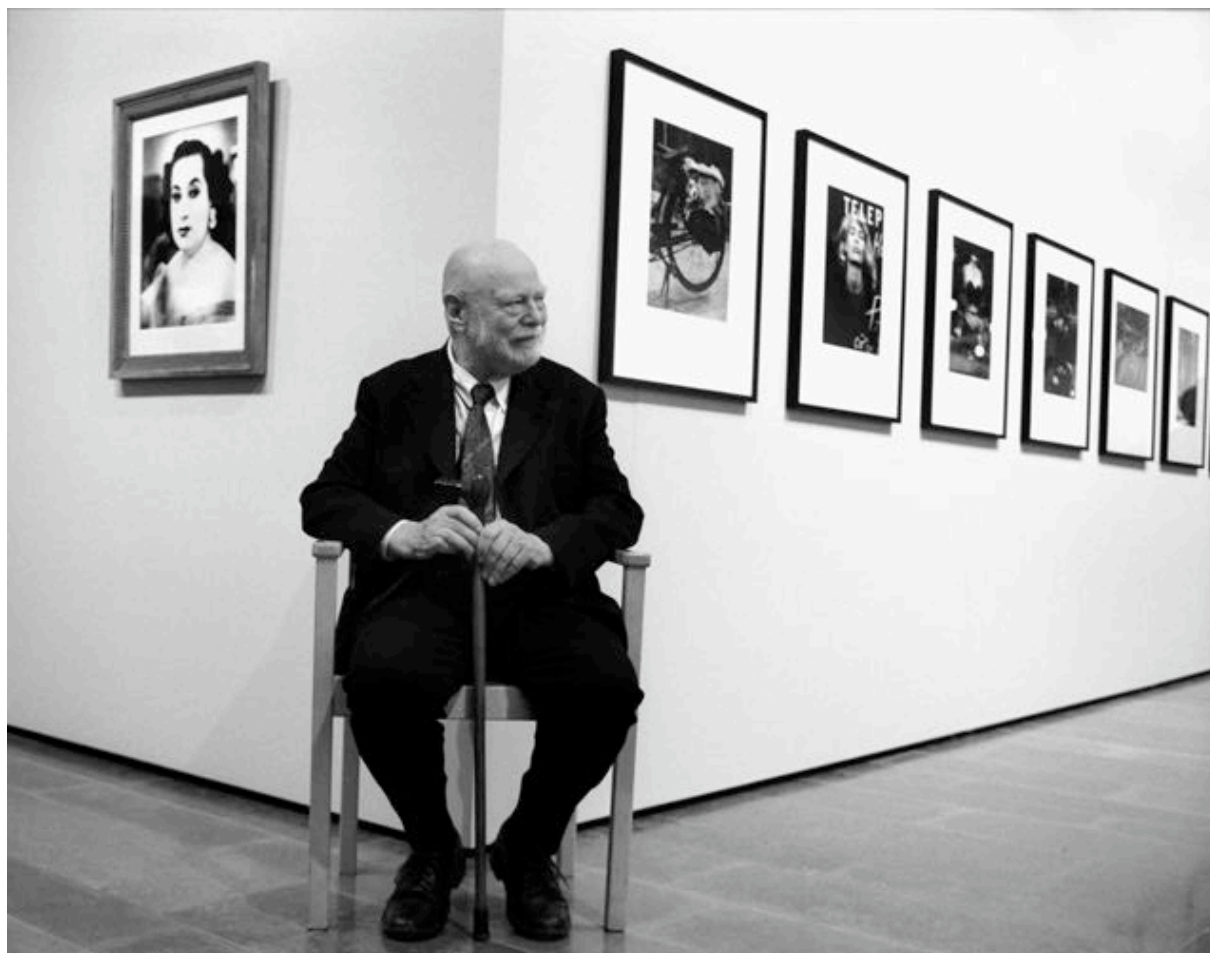
Christer Strömholm, 1998, Hasselblad Center, Göteborg

...betydande fotografi kan aldrig göras på genvägar. Det är människan som skall tala med teknikens medel.