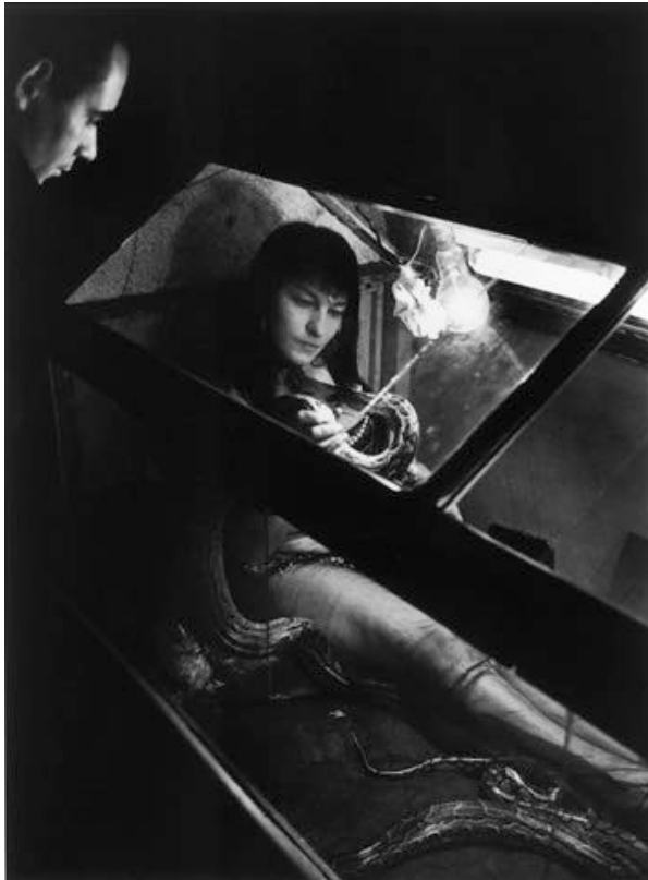
Pigalle, Paris 1955

En av dom starkaste fotografier som Christer Strömholm gjort är för mig kvinnan som kelar med en jättelik orm. En stående bild fotograferad under natten. Hon befinner sig i en glasbur med lysrör.